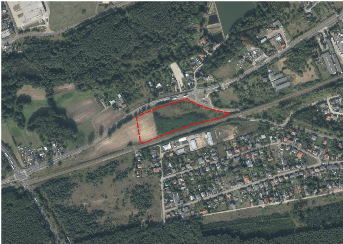
Ryc. 1 Fragment ortofotomapy z zaznaczoną granicą obszaru objętego opracowaniem